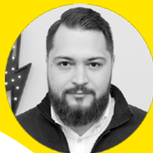
ЕВГЕНИЙ ШЕСТАКОВ Rush Agency